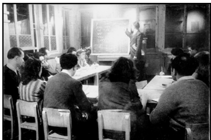
Mit Geflüchteten eine Perspektive aufzubauen, war schon zu Gründungszeiten eine Kernaufgabe der SFH: Englischkurs vor der Weiterreise, Zürich 1944