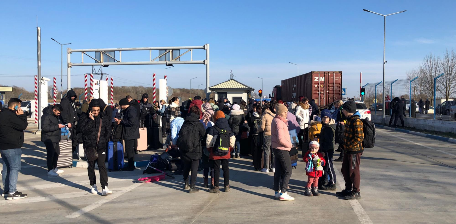
Moldavie. Un centre de transit à la frontière ukrainienne se prépare à l'afflux de réfugiés