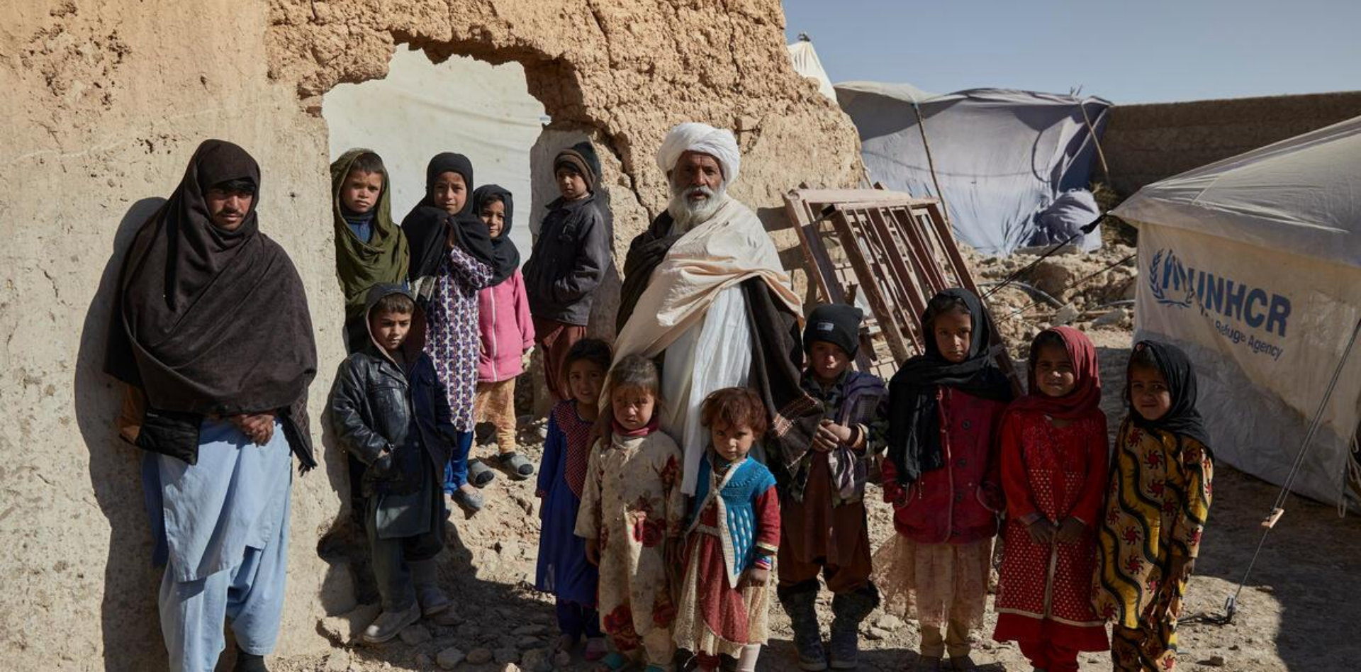
Afghanistan. Une famille déplacée retourne reconstruire sa maison endommagée dans la province de Helmand.