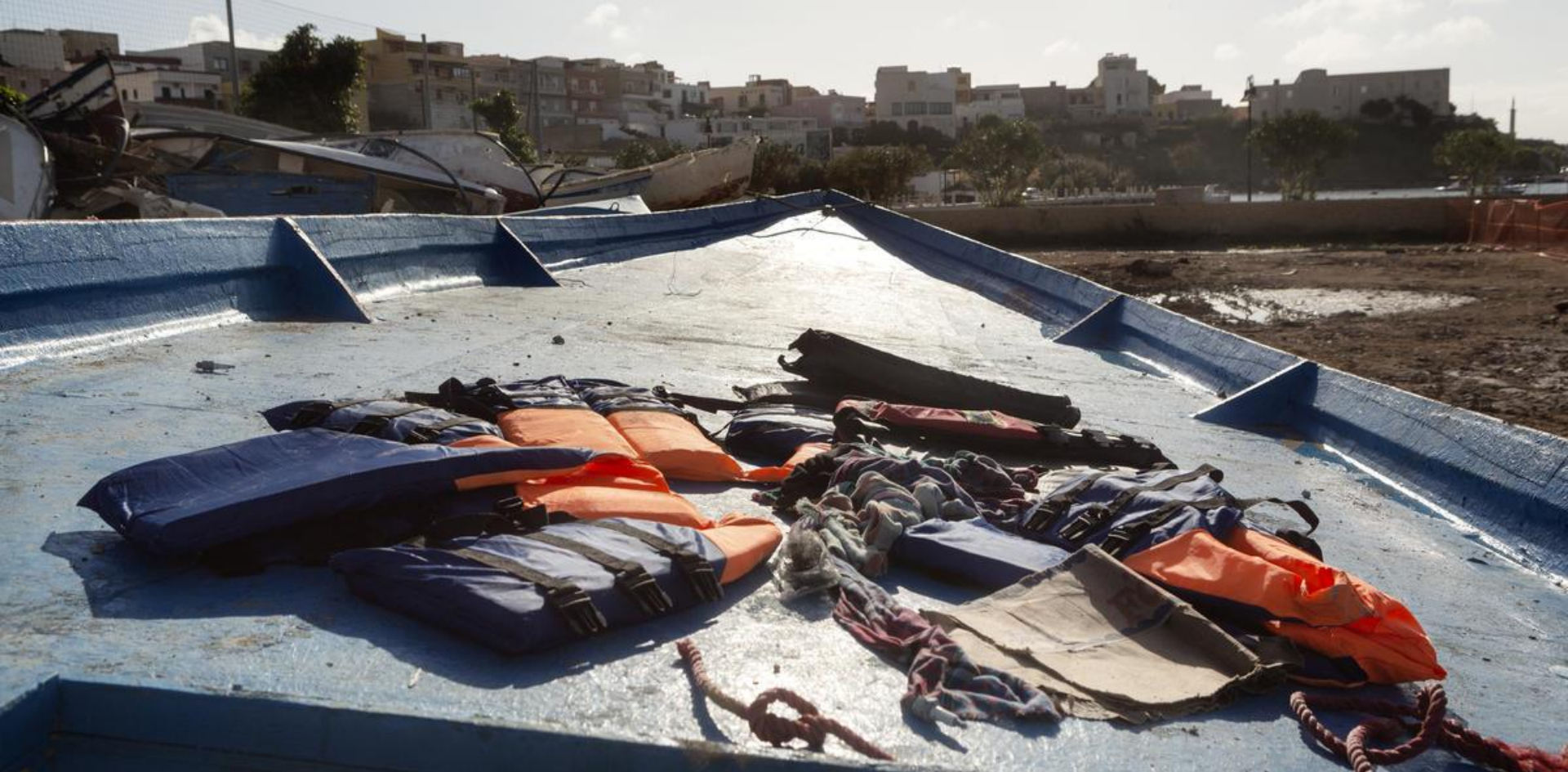
Italie. L'île de Lampedusa, à la croisée des chemins des réfugiés.