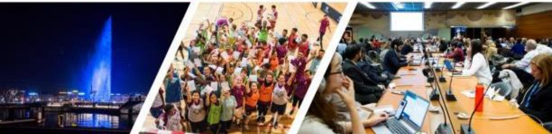
Evénements à Genève durant le premier Forum mondial sur les réfugiés, en décembre 2019.