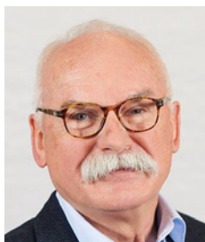
Direktor Caritas Directeur Caritas