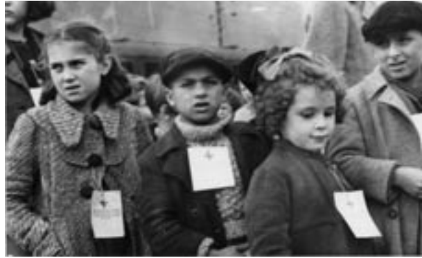
1944, Flüchtlingskinder aus Italien.

Integration ist in der Schweiz zu einem wichtigen öffentlichen Thema geworden. Dies ist insofern erfreulich, als es für unsere Gesellschaft ja von grösster Bedeutung ist, alle Menschen, die hier leben, am wirtschaftlichen, sozialen, kulturellen und politischen Leben zu beteiligen. Das heftige Interesse der politischen Parteien lässt indes eine wenig sachgerechte Behandlung des Themas befürchten. So wird bereits mit populären Anpassungsforderungen an die Adresse der Zugewanderten öffentlich Stimmung gemacht und um die Gunst des Stimmvolks gebuhlt. Die SFH wird versu-