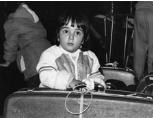
1989, Flüchtlingskind aus Iran, Ankunft in Zürich.