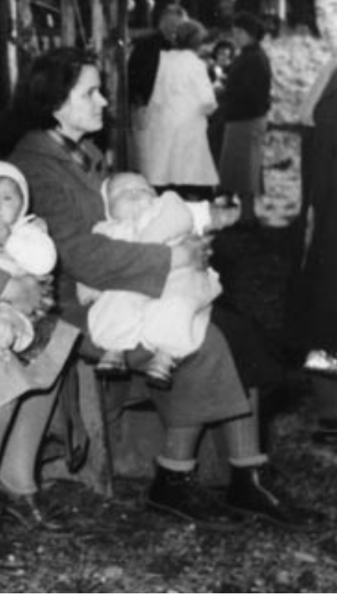
1956/57, Ungarische Flüchtlinge, Ankunft in Buchs.

ratekampagne gegen das Asylgesetz, in der unter anderen auch der Leiter der Schweizer Bischofskonferenz, Amadée Grab und der Präsident des Schweizerischen Evangelischen Kirchenbundes (SEK), Thomas Wipf, Stellung nahmen.