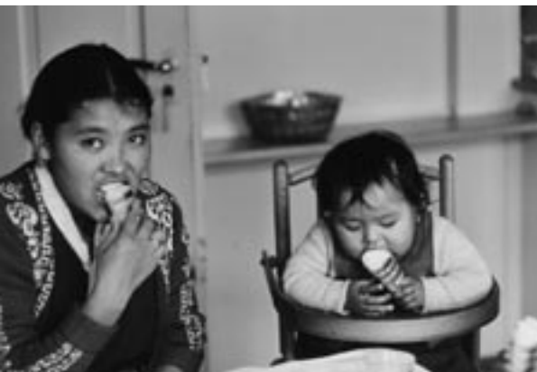
1960, tibetanische Kinder.

Daher mussten die TibeterInnen, die einen Nichteintretensentscheid erhalten haben, ein Wiedererwägungsgesuch einreichen. Die SFH hat den Rechtsberatungsstellen für Asylsuchende zu diesem Zweck ein Muster zur Verfügung gestellt. Mit den Beschwerden konnten TibeterInnen, die einen Nichteintretensentscheid erhalten haben, eine erneute Prüfung ihres Asylgesuchs erwirken. Sie erhielten den Flüchtlingsstatus oder wurden zumindest vorläufig aufgenommen, was es ihnen ermöglicht, zu arbeiten und wieder in die Sozialhilfestrukturen integriert zu werden.