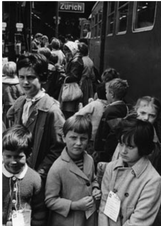
40er-Jahre, Flüchtlingskinder aus Österreich. Ankunft in Zürich.

be zu bewältigen. Die SFH sammelt Gelder und dient als Schnittstelle zwischen den verschiedenen Hilfswerken und den Gemeinde-, Kantons-, und Bundesbehörden. Gegen Kriegsende werden auf dem Gebiet der Schweiz über 116 000 Flüchtlinge und Internierte gezählt. Doch in den Jahren 1942 bis 1944 schicken die Schweizer Behörden über 10 000 Flüchtlinge, die meisten davon Juden, über die Grenze zurück in