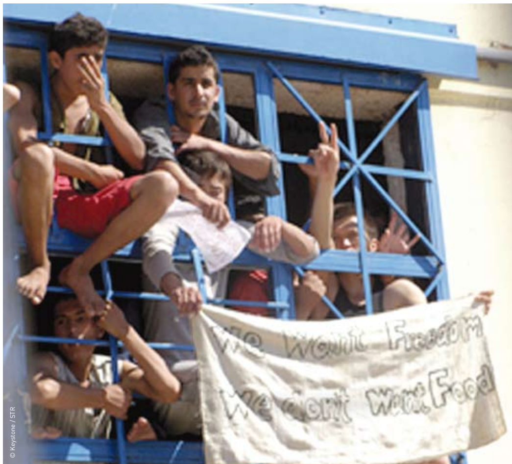
Lesbos, Griechenland: Jugendliche Flüchtlinge protestieren mit einem Hungerstreik gegen die katastrophalen Zustände im Internierungszentrum Pagani.

Auch bei der Anerkennungsquote gibt es eklatante Unterschiede zwischen den einzelnen Ländern: In Belgien, Frankreich und Deutschland wurde weniger als 25 Prozent der Gesuche entsprochen. In Ägypten, Finnland, Kenia, Malaysia, Norwegen, Polen, Sudan, Schweden, Grossbritannien und der Türkei haben hingegen über drei Viertel der UMA Schutz erhalten.