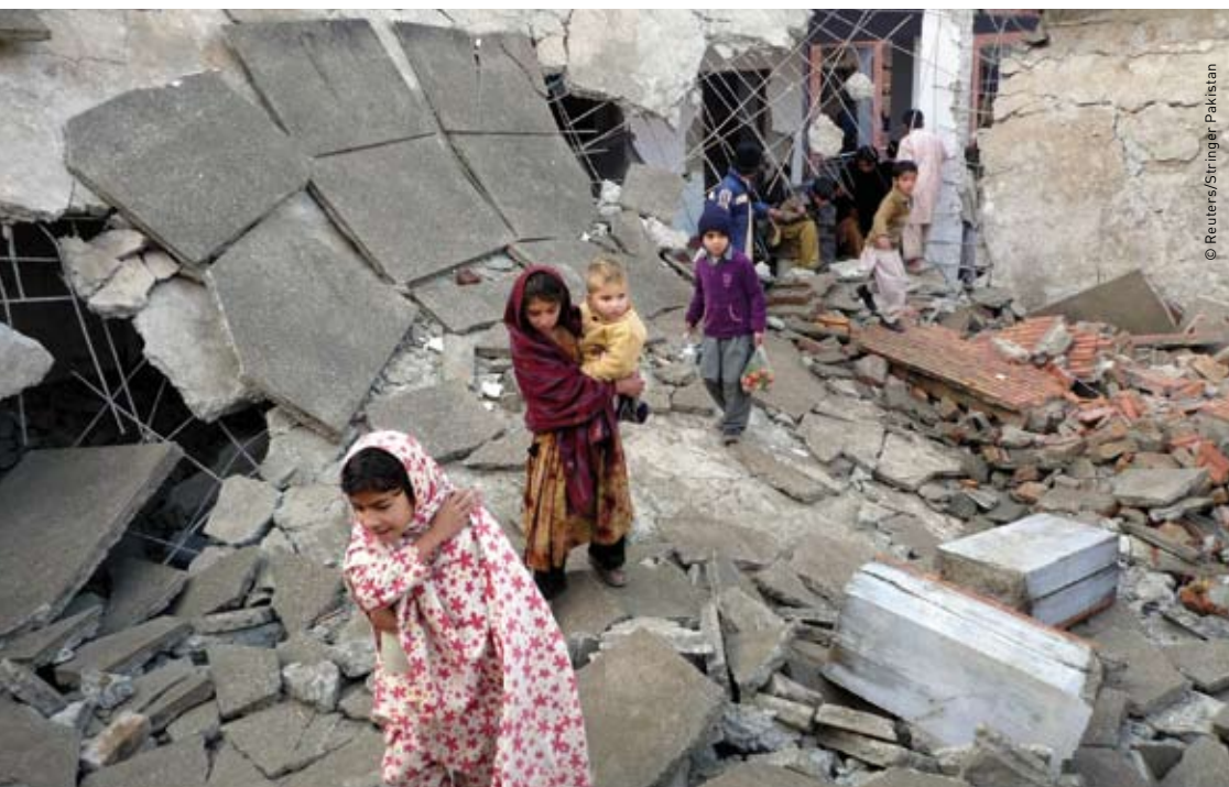
Ein Trümmerfeld: Kinder besichtigen ihre zerstörte Schule im Swat-Tal.

Anfang Mai 2009 startete die pakistanische Armee eine Offensive gegen die Taliban im Swat-Tal – und löste damit die grösste Fluchtwelle intern vertriebener Personen seit der Gründung des Landes 1947 aus. Alexandra Geiser