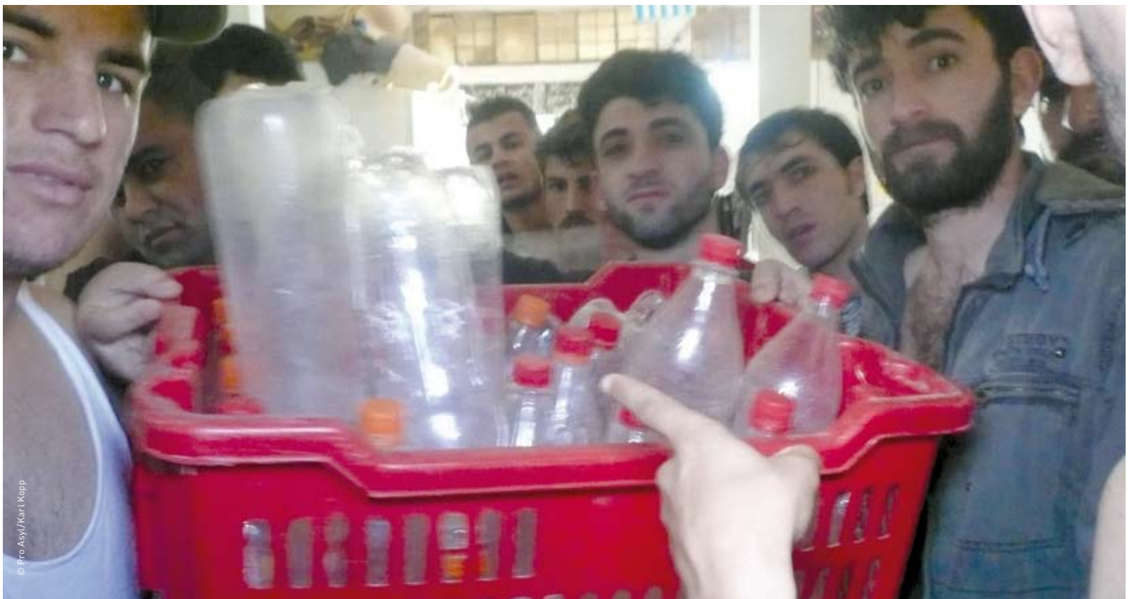
PET-Flasche als Dusche: Szene aus einem griechischen Haftlager für Asylsuchende.

Diese neuesten Entwicklungen an den Aussengrenzen Europas lassen befürchten, dass der Schutz vor Flüchtlingen höher gewichtet wird als deren Schutz. Menschen, die in Europa Zuflucht vor Krieg oder Verfolgung suchen, muss der Zugang zu einem fairen Asylverfahren aber gewährt sein.