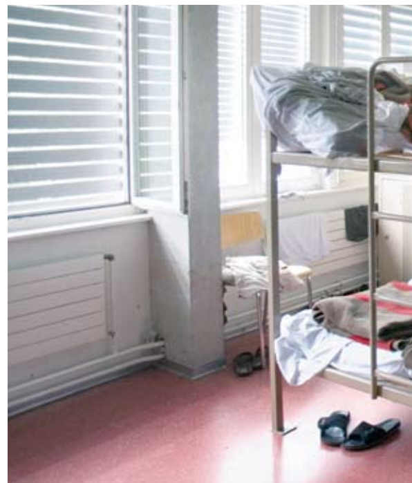
Keine Privatsphäre: Blick in eine Kollektivunterkunft.

Auch das Bundesamt für Migration (BFM) hatte auf Drängen der Kantone ein dreijähriges Monitoring eingeführt. Im Sep-