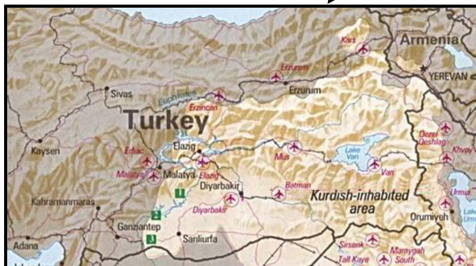
Abbildung 2: Karte türkisches Kurdengebiet. 3