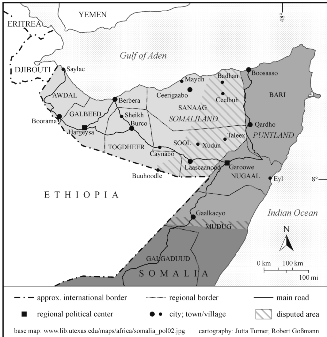
Karte II: Politische Teilung im Norden Somalias (Somaliland und Puntland).