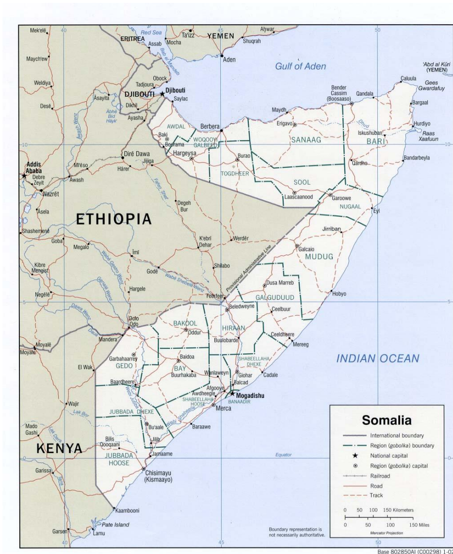
Karte I: Somalia, politisch, Internetquelle: http://memory.loc.gov/cgi-bin/query/h?ammem/gmd:@field(NUMBER+@band(G8350+CT001671)) .