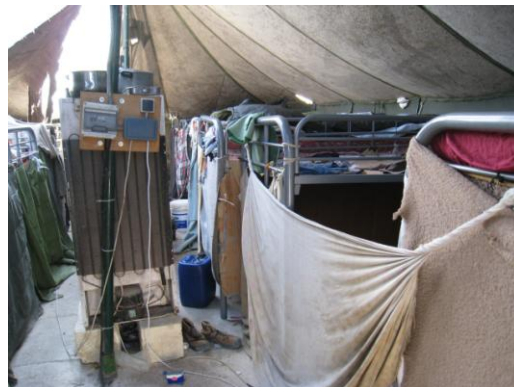
Zelt, Hal Far Tent Village.

Familien und alleinstehende Mütter sind in Containern untergebracht. Teilweise leben in einem Container mehrere Familien. 22 Die Platzverhältnisse sind dementsprechend eng. Die Familien schlafen und kochen im selben Raum. Die Unterkünfte der Frauen und Familien liegen nahe bei den Zelten. Das Gelände ist sehr gross und wird nur von zwei Sicherheitsbeamten kontrolliert. Man muss daher davon ausgehen, dass für Frauen und Kinder Sicherheitsbedenken bestehen, insbesondere nachts etwa beim Gang zu den Toiletten. 23