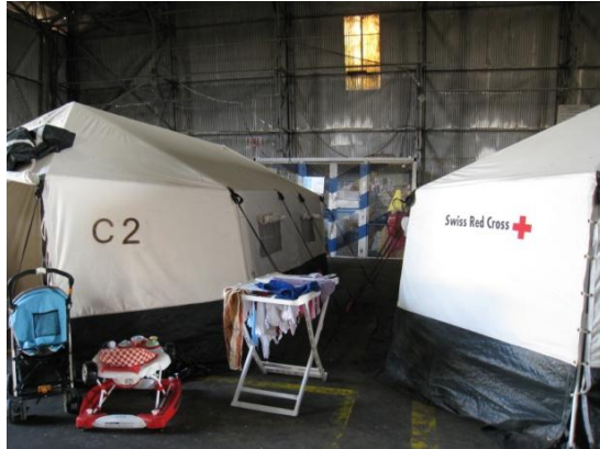
Familienzelte im Hal Far Hangar.

dort untergebracht, zum Zeitpunkt des Besuchs 462, davon 42 Familien und vier alleinstehende Mütter mit Kindern. Insgesamt waren zur Zeit des Besuchs 49 Kinder dort, davon zwei Neugeborene. 25