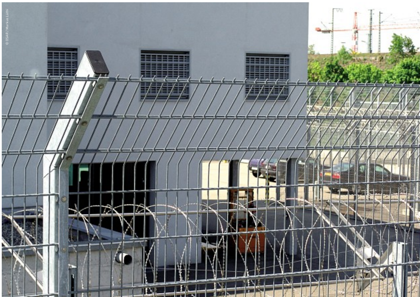
Un centre de détention aux fins d'expulsion à l'horizon: La vue depuis le centre d'enregistrement de Bâle.

La plupart des propositions de changement portent directement sur la protection accordée aux personnes persécutées. Ainsi, les durcissements planifiés visent à réduire l'attrait de la Suisse. Or ils ne changent rien à la triste réalité des persécutions à travers le monde. Pourquoi alors de nouveaux durcissements? La loi sur l'asile doit demeurer un instrument garantissant la protection nécessaire aux personnes exposées à des persécutions.