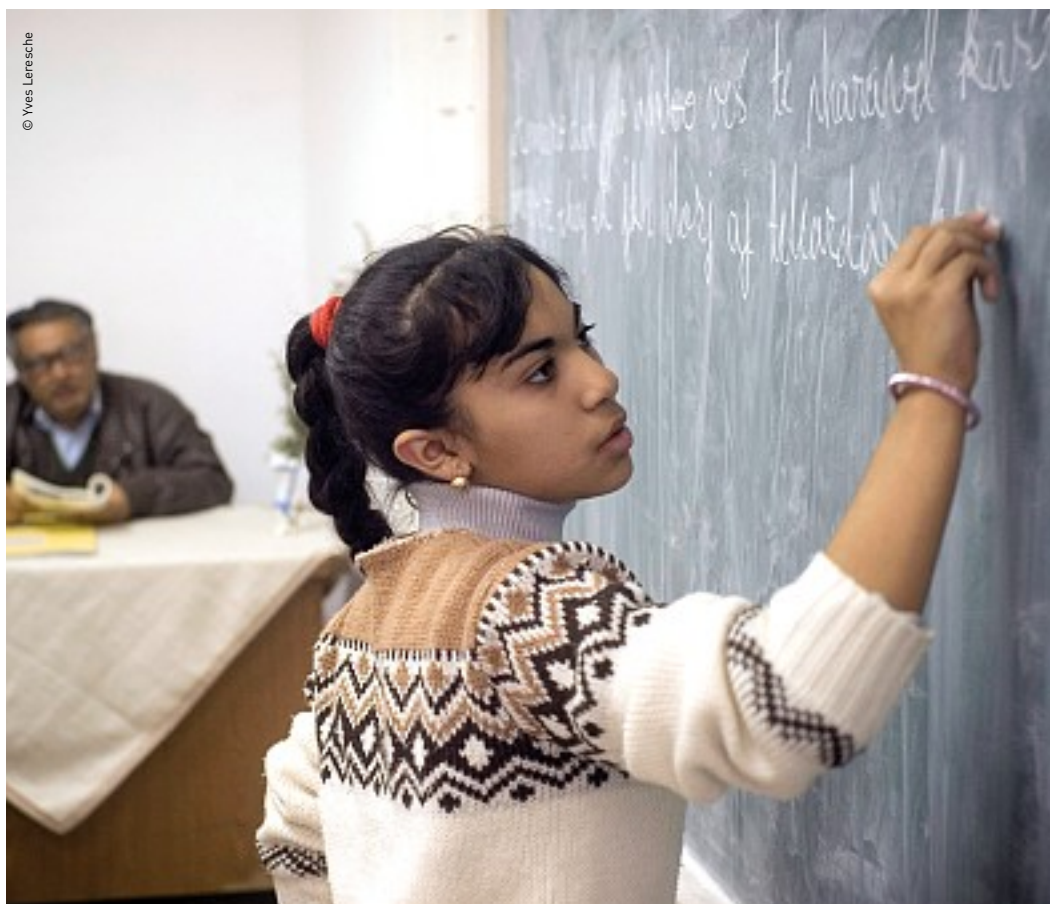
Cours de romanes à Maguri en Roumanie.

Les Roms n'ont jamais prétendu disposer d'un espace territorial. Ils forment ainsi une minorité ethnique éparpillée entre de nombreux Etats européens et néanmoins restée très attachée à sa culture. Ils auraient réellement mérité que les médias et le monde politique donnent d'eux une image qui ne soit ni trompeuse ni superficielle, et encore moins négative ou stéréotypée, mais qui corresponde à ce qu'ils sont réellement.