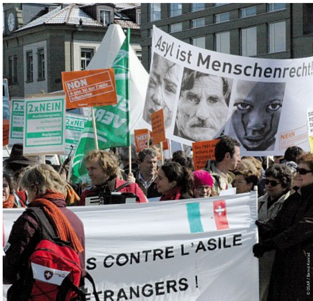
Manifestation à Berne contre la révision de la loi sur l'asile de 2006.

Aujourd'hui, un nouveau durcissement de loi est imminent (voir article p. 2). Et aucun revirement en faveur des requérants n'est en vue. La loi suisse sur l'asile, jadis généreuse, est détournée de sa finalité pour se muer en système dissuasif. Pourtant, les réfugiés ont besoin non pas de mesures de dissuasion, mais d'une protection illimitée.