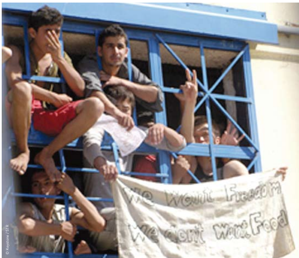
Lesbos, Grèce: de jeunes réfugiés protestent par une grève de la faim contre les conditions désastreuses du centre d'internement de Pagani.

On note aussi des différences flagrantes entre les pays pour ce qui est des taux de reconnaissance: en Belgique, en France et en Allemagne, moins de 25% des demandes ont été approuvées. En Egypte, en Finlande, au Kenya, en Malaisie, en Norvège, en Pologne, au Soudan, en Suède, en Grande-Bretagne et en Turquie en revanche, plus de trois quarts des MNA ont obtenu une protection.