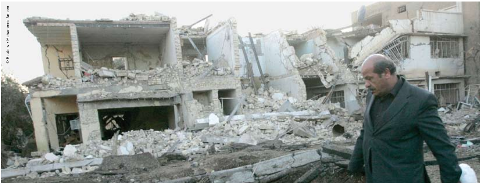
Maisons totalement détruites après un attentat à la bombe – une image fréquente à Bagdad.